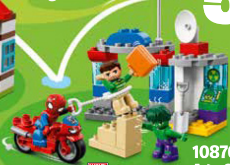
10876 Age 2-5