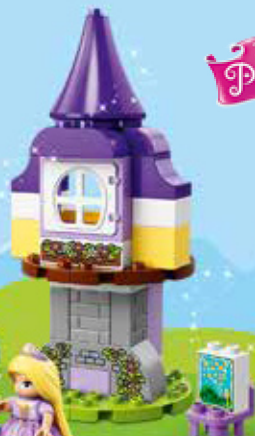
10878 Age 2-5