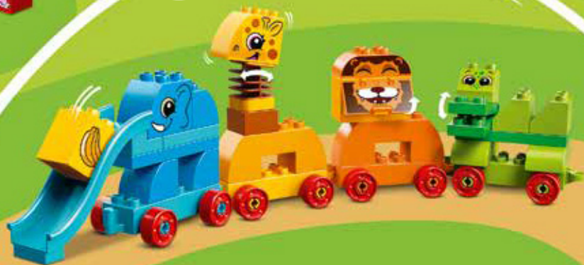
10863 Age 1½-3