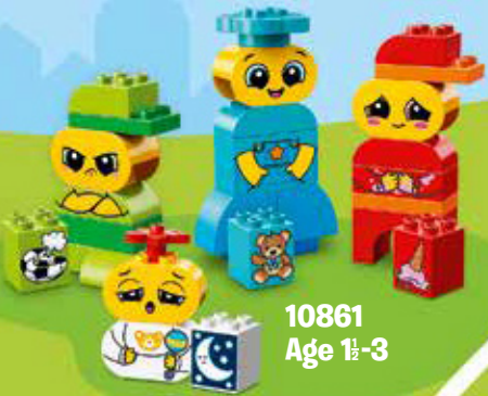
10861 Age 1½-3