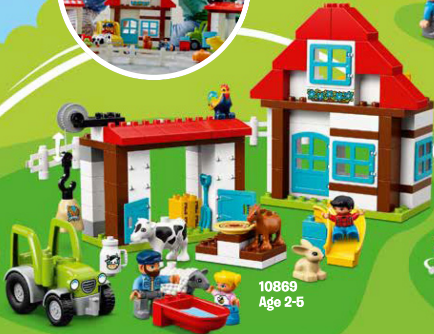
10869 Age 2-5