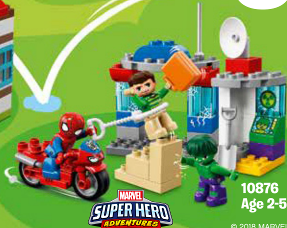
10876 Age 2-5