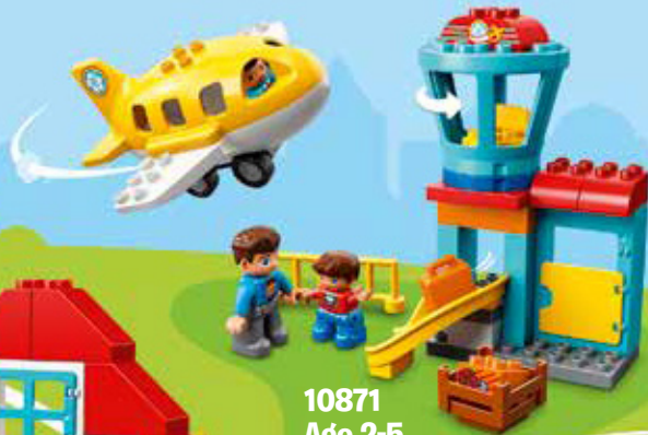
10871 Age 2-5