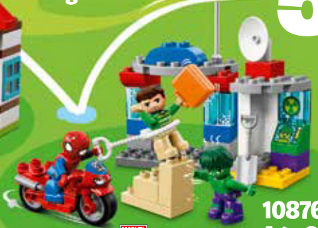
10876 Age 2-5