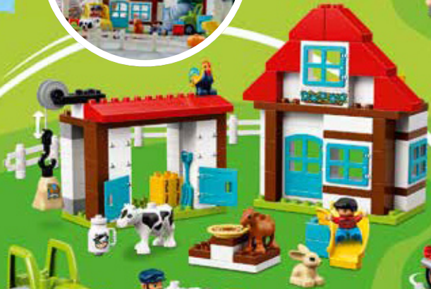
10869 Age 2-5