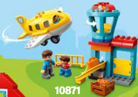
10871 Age 2-5